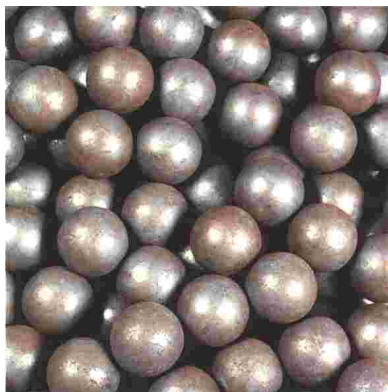
Kugeln: Ø20mm - Ø150mm 59 – 65 HRC