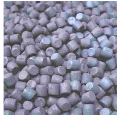
Cylpebs : 8x8mm - 40x40mm 46 – 58 HRC