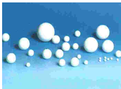
Perlen und Kugeln